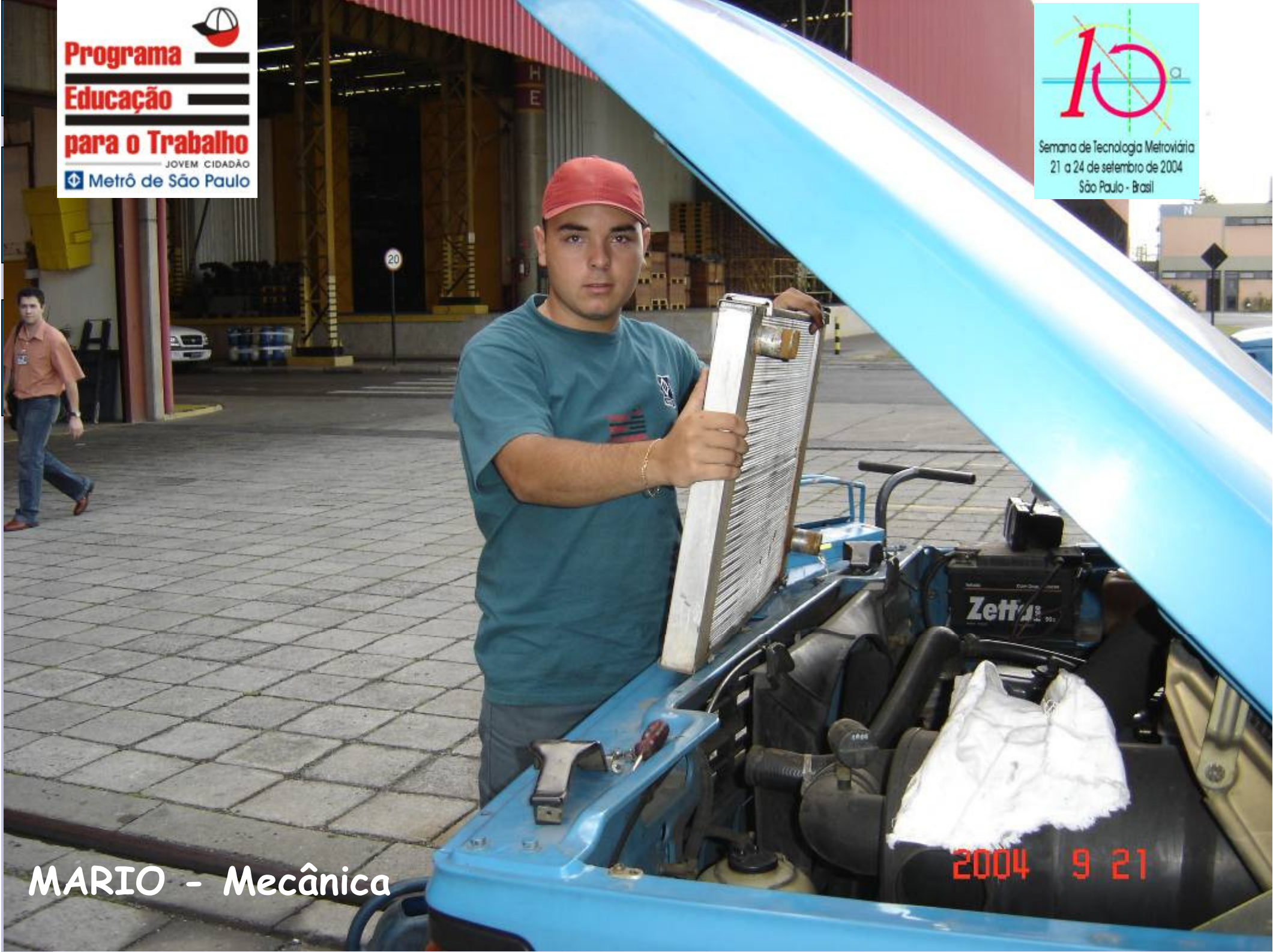
MARIO - Mecânica