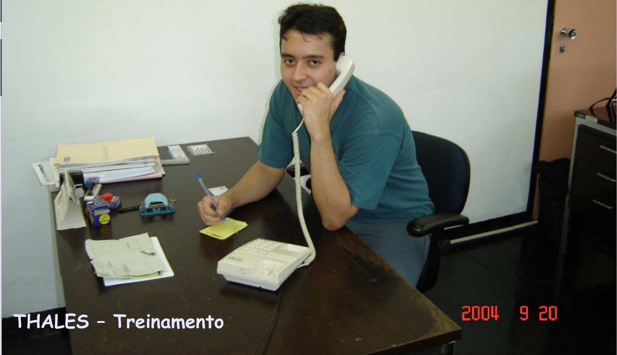
THALES - Treinamento