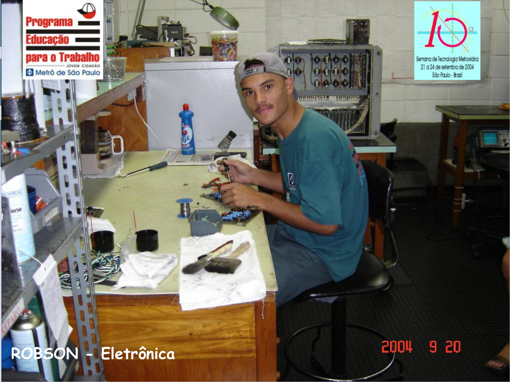
ROBSON - Eletrônica