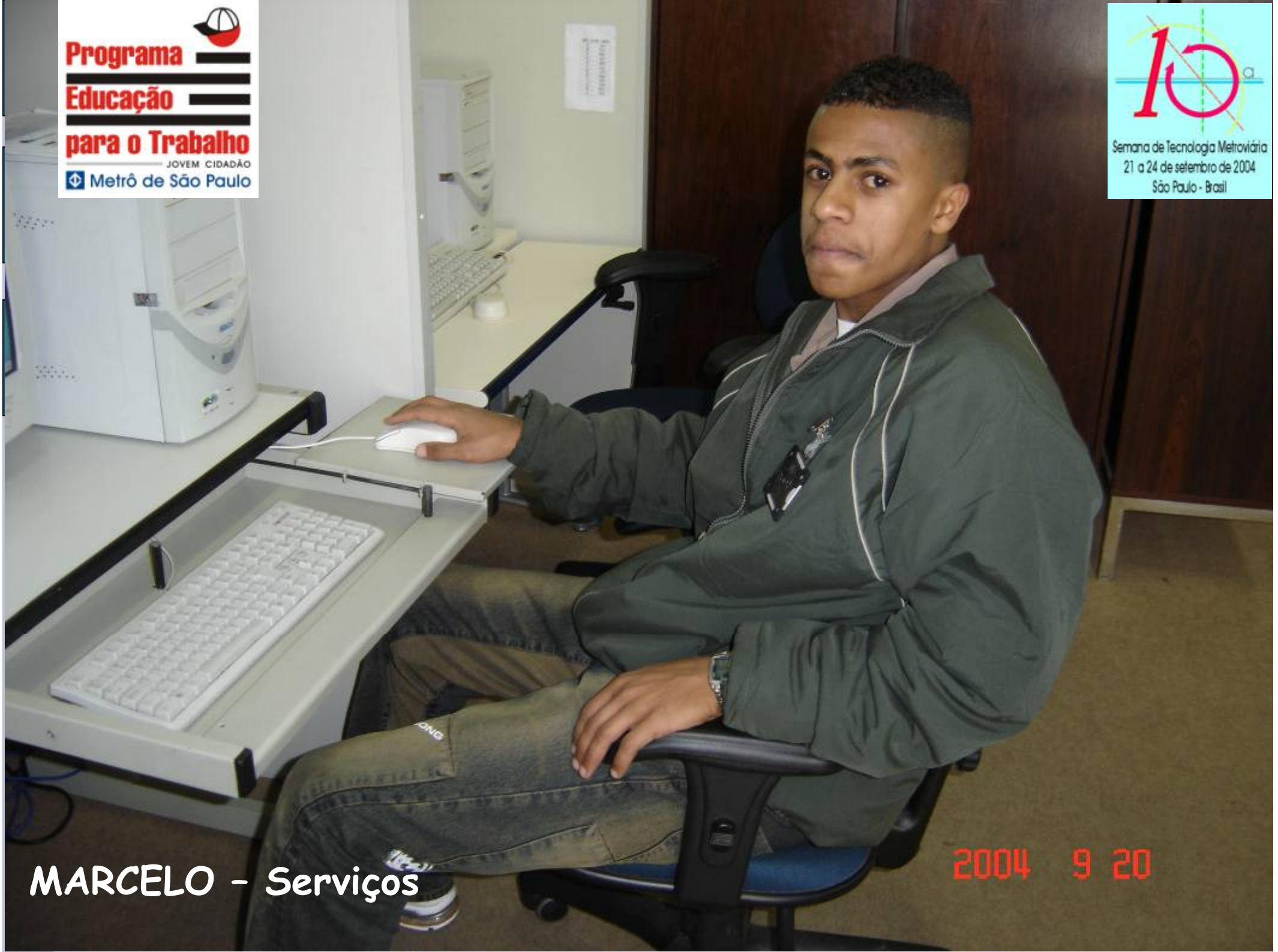
MARCELO - Serviços