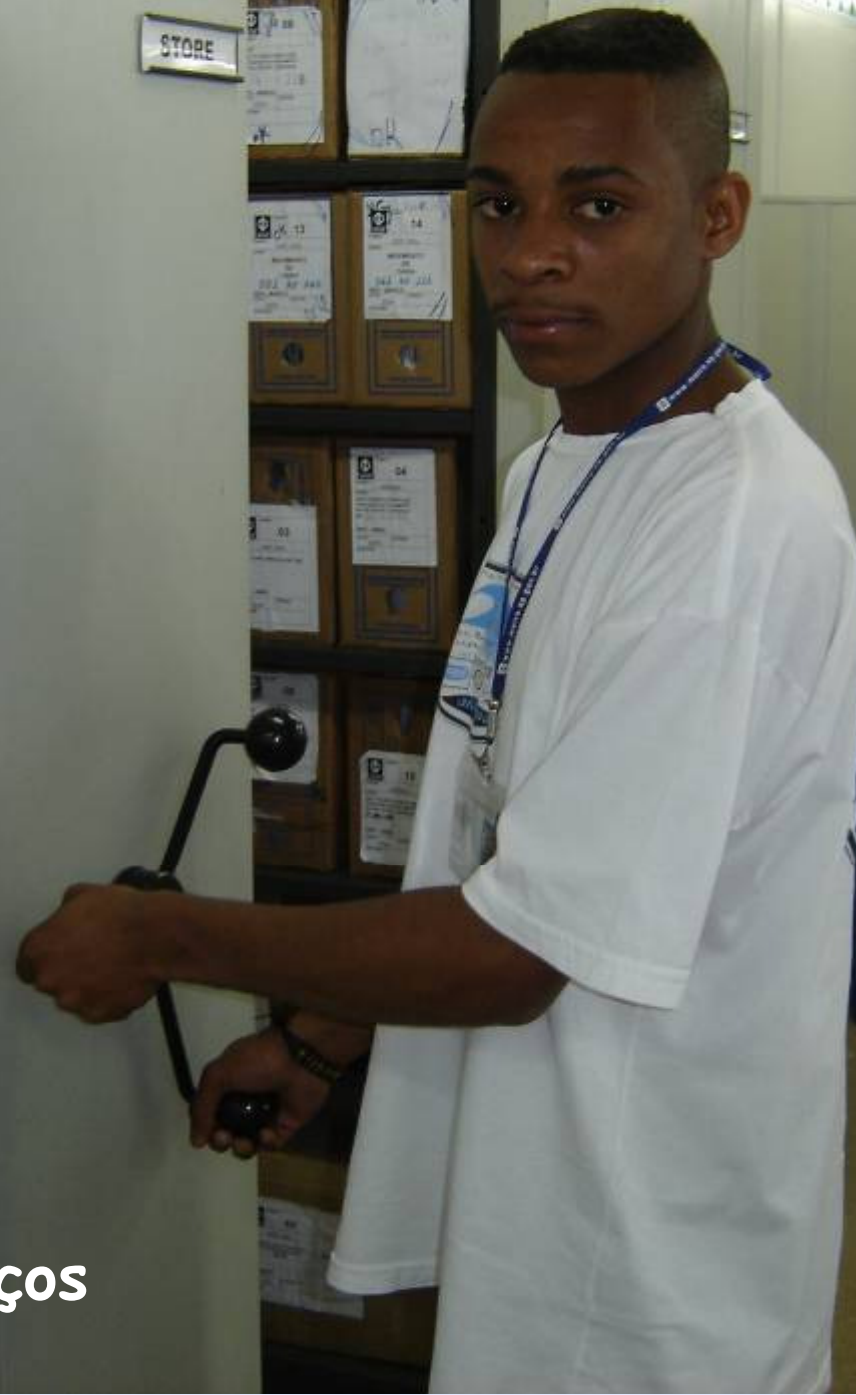
RICARDO - Serviços