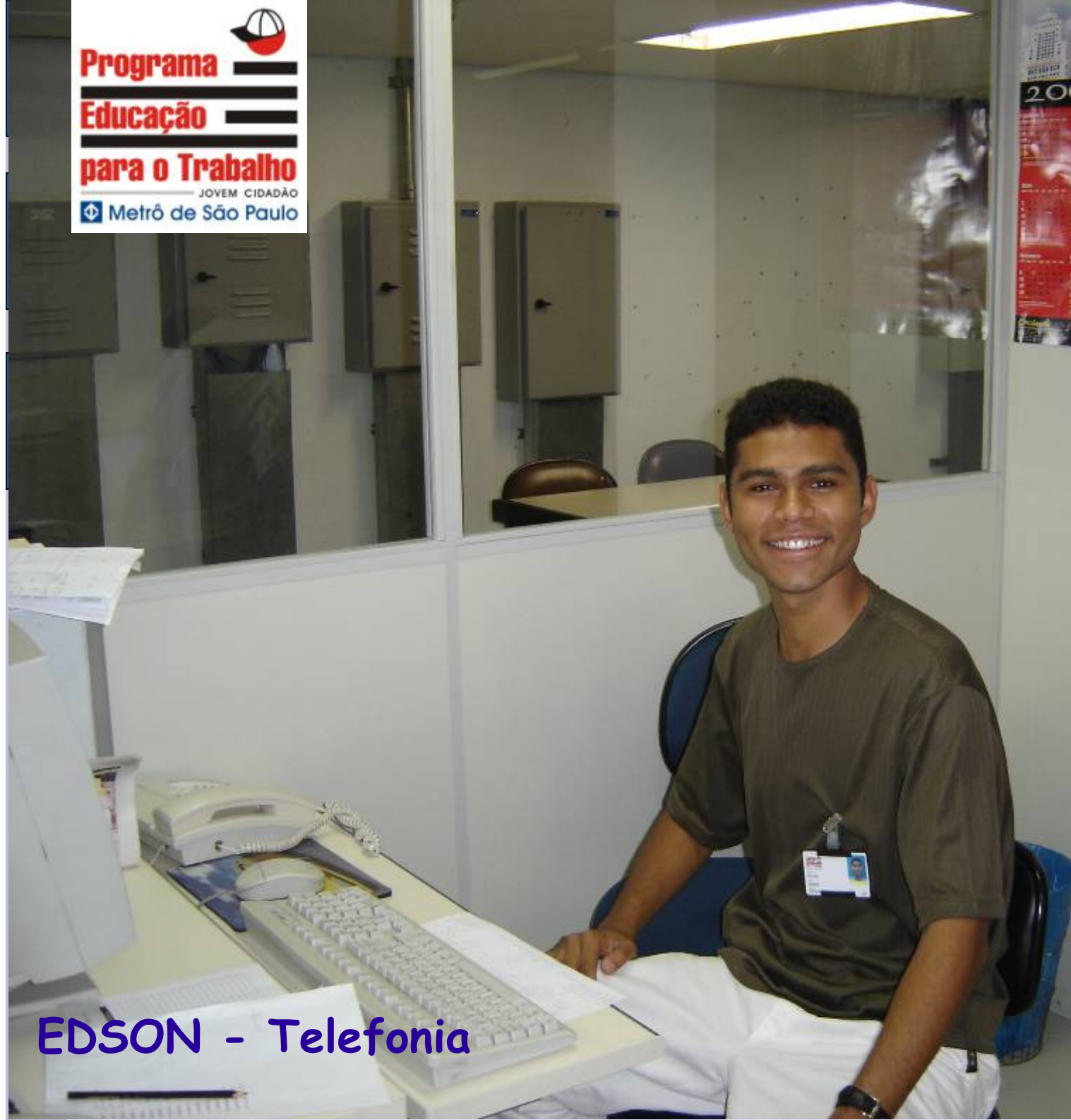
EDSON - Telefonia