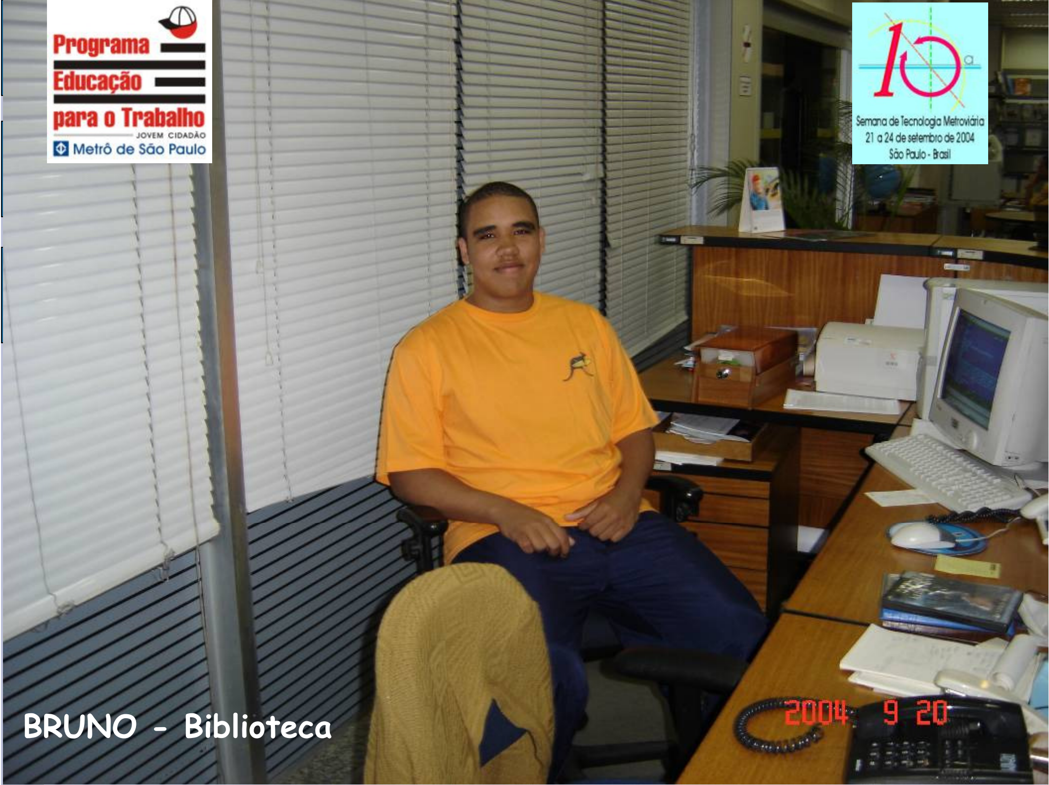
BRUNO - Biblioteca