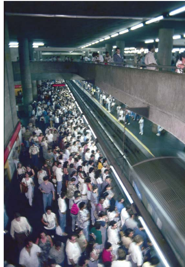
Hora de pico no Metrô de São Paulo

Para efeito de comparação, na Índia a concentração nas 10 maiores cidades é de 7,2 % enquanto no Reino Unido não passa de 19.9 %. Nos dois países é intenso o tráfego ferroviário interurbano