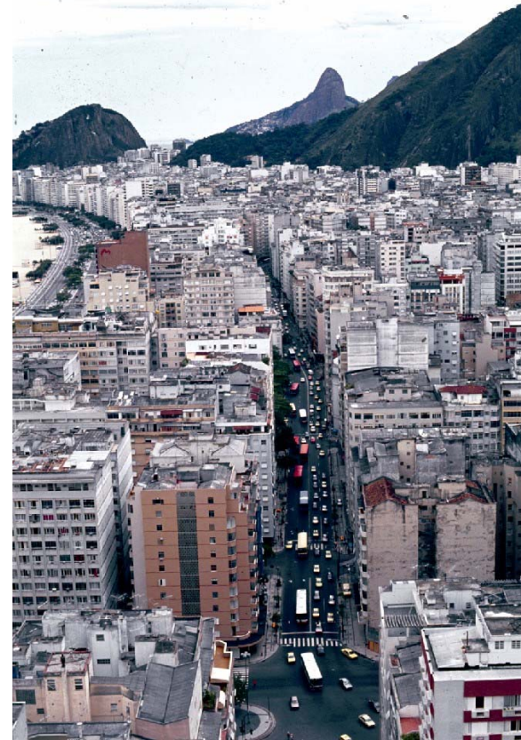
N.Sra. Copacabana Avenue, in Rio.

O Brasil detem o récorde de concentração demográfica em cidades grandes: 31 % dos brasileiros, 57 milhões de pessoas, vivem em nas 10 maiores regiões metropolitanas