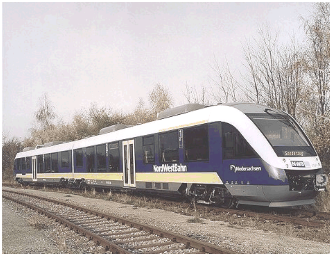
TUD da Nordwest Bahn, Alemanha

O objetivo principal é divulgar as oportunidades junto aos empresários e criar condições para que venham a participar dos projetos