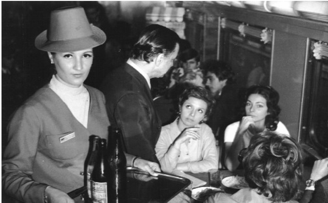
Servico de restaurante no Vera Cruz