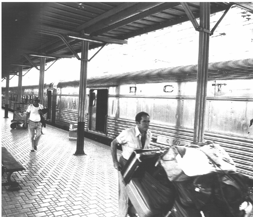
Estação D. Pedro II no Rio de Janeiro em 1985.

Na década de 80, os poucos trens que subsistiam foram progressivamente encerrados pela Rede e pela Fepasa