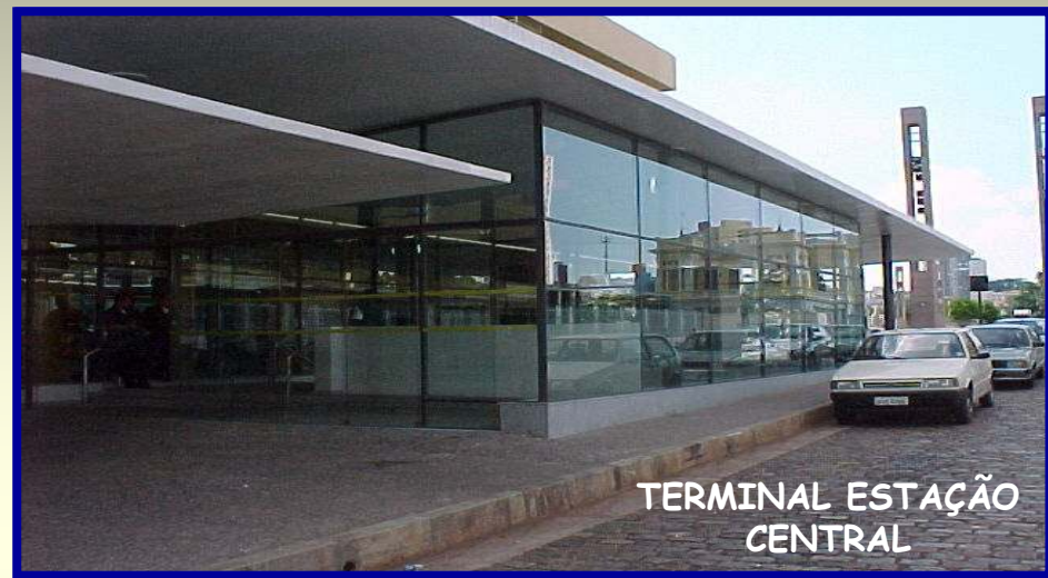
TERMINAL ESTAÇÃO CENTRAL