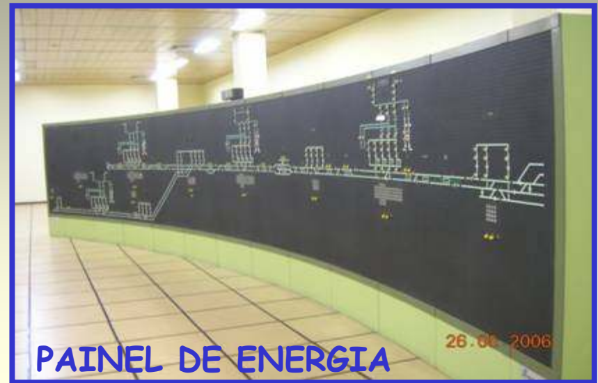
PAINEL DE ENERGIA