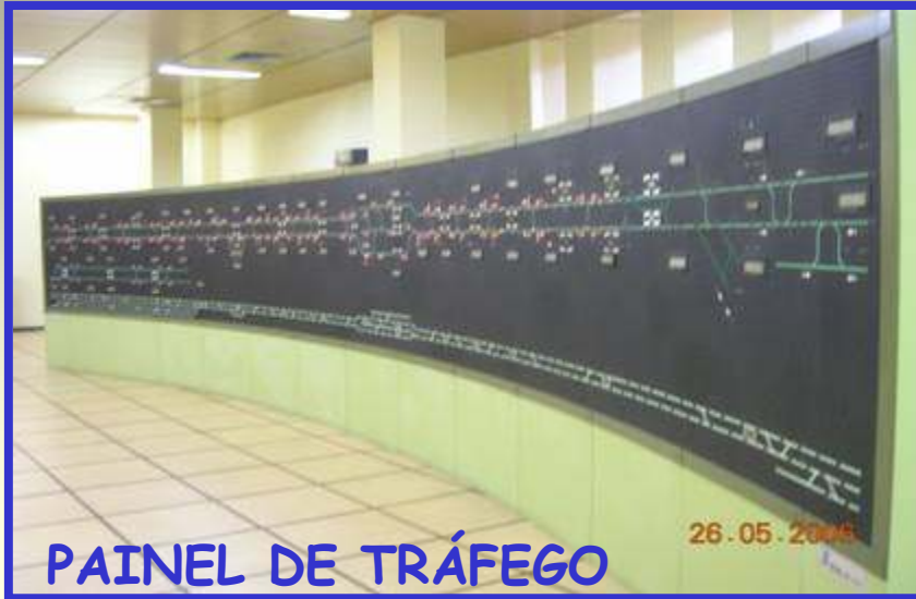
PAINEL DE TRÁFEGO