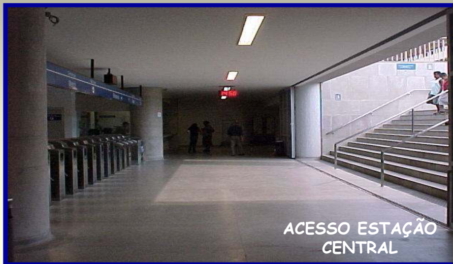
ACESSO ESTAÇÃO CENTRAL