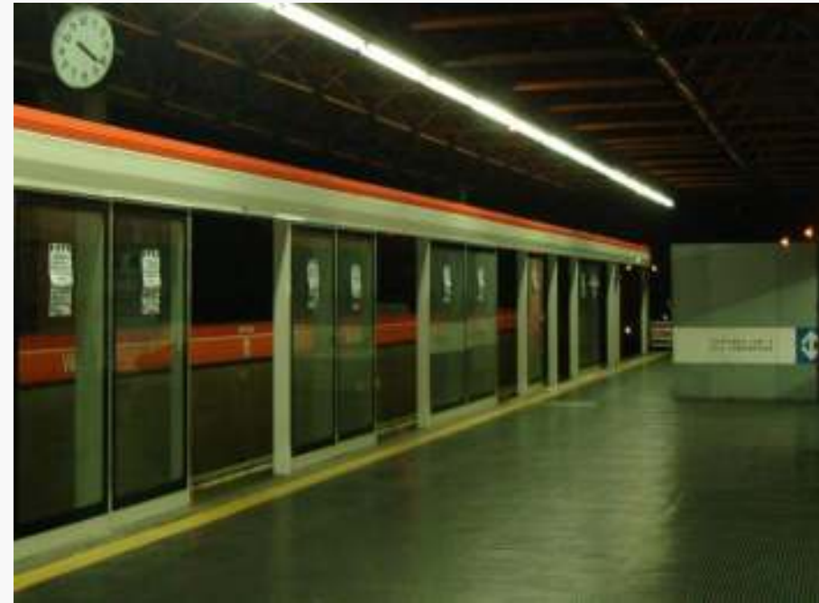
Estação Vila Matilde Em testes