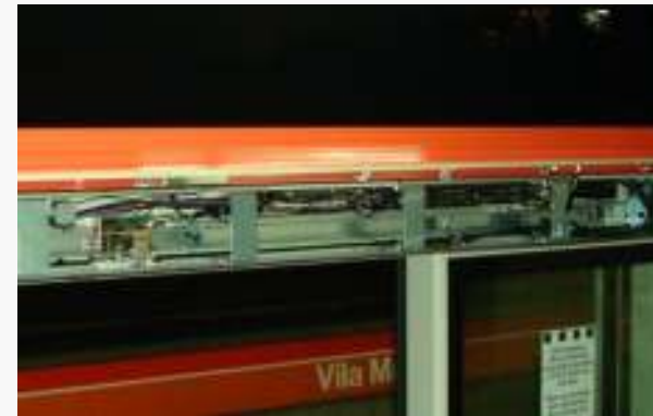
Unidade de controle das portas deslizantes