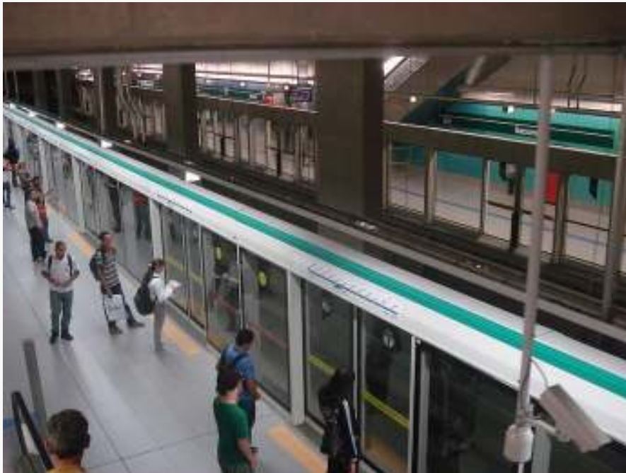
Estação Sacomã Em operação