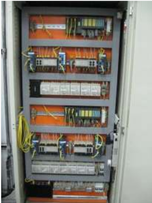
Armário do detector secundário de abertura e fechamento das portas dos trens