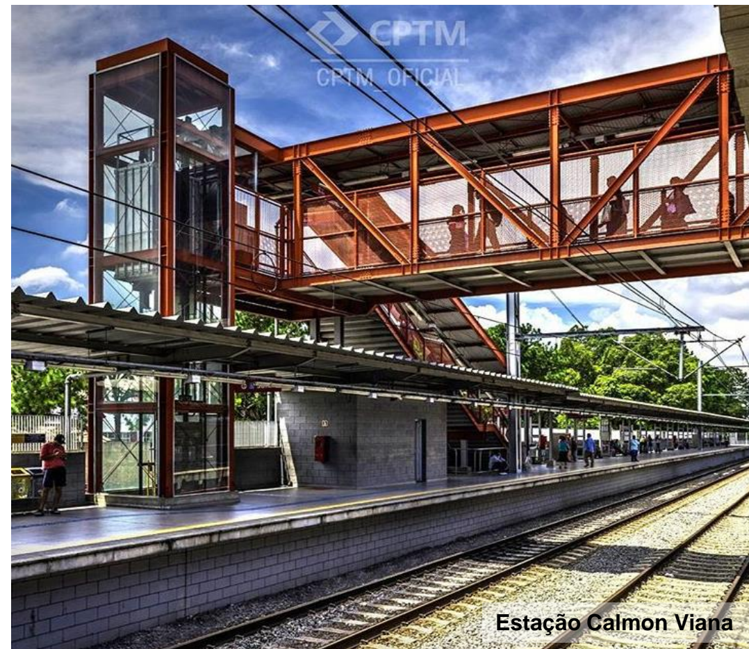
Estação Calmon Viana

Em obras: Guapituba, R.G. Serra, Rib. Pires, Luz, Sta Terezinha, A. Gianetti, Jaraguá.