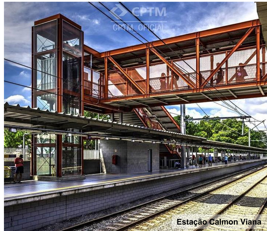
Estação Calmon Viana

Em obras: Guapituba, R.G. Serra, Rib. Pires, Luz, Sta Terezinha, A. Gianetti, Jaraguá.